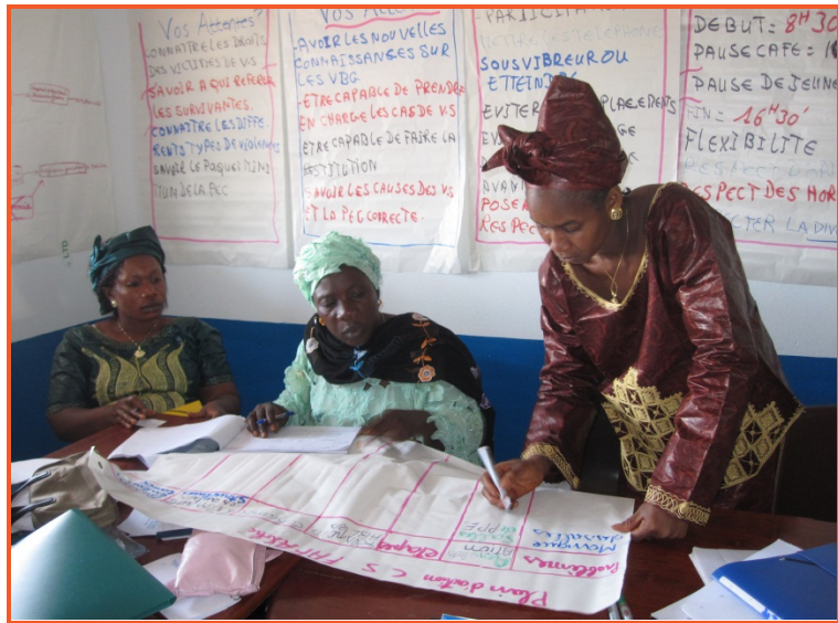
Prestataires de santé de Labé développant un plan d'action pendant la formation.

Les participants ont également apporté des commentaires sur la formation elle-même, en utilisant l'échelle de Likert pour ranger les différents aspects de la formation (sur une échelle de 1 à 5, 1 indiquait qu'ils étaient fortement en désaccord et 5 fortement en accord). La note moyenne la plus basse (3,8) intéressait la déclaration-ci: «Cinq jours de formation suffisent pour savoir comment offrir des services de qualité aux victimes de violences sexuelles.» La déclaration avec la meilleure note moyenne (4,9) était la suivante: «Je mettrai en pratique ce que j'ai appris dans cette formation.» Tous les autres engagements ont reçu des notes au-dessus de 4,4. En outre, les participants ont évalué la qualité de chaque session de formation sur une échelle de 1 (minimum) à 5 (maximum). Toutes les séances ont reçu une note d'au moins 4,4.