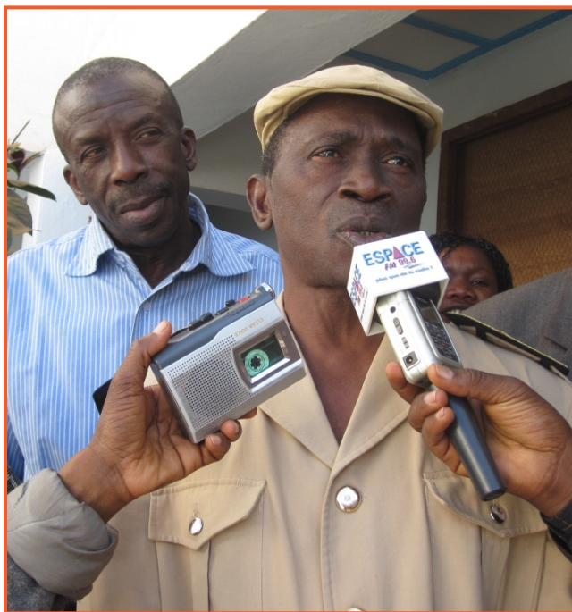
Le Gouverneur de Labé, M. Sadou Keita (à droite), a présidé la session de clôture de la formation des prestataires de soins de santé. La session a été diffusée sur la radio nationale guinéenne.

Après les deux formations de prestataires de soins de santé, RESPOND a amélioré le programme en fonction des commentaires des prestataires participants et des animateurs. Le Ministère de la Santé (MOH) a animé un atelier pour réviser et valider le programme des prestataires. RESPOND a effectué les changements de mise en forme finale qui ont été suggérés et le MOH adoptera le programme d'études comme son propre programme national de lutte contre les VS. Auparavant, le MOH avait un protocole pour la prise en charge des survivants de VS, mais pas de programme de formation pour les prestataires. Le MOH est à la recherche d'un support pour intensifier la formation à travers le pays avec ce programme d'études.